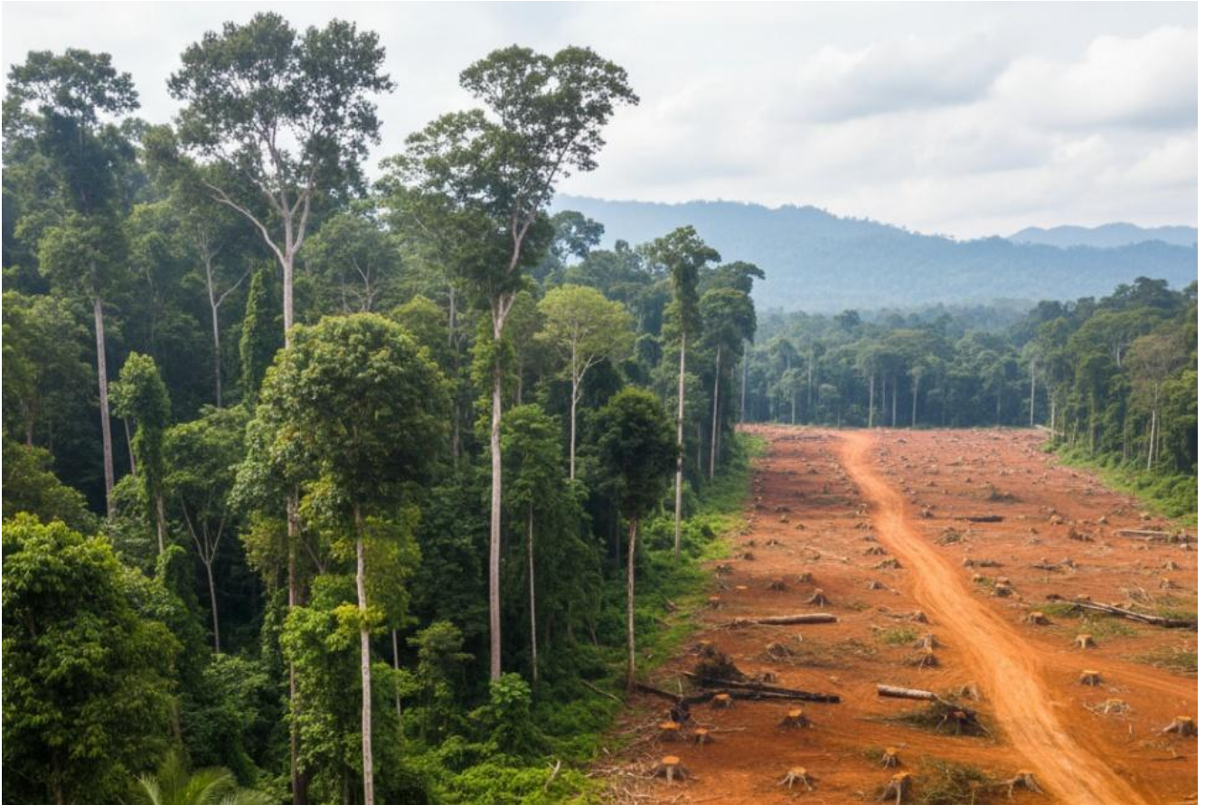
KI-generiert mit Gemini Flash 2.5 (Prompt: Ein Bild auf dem man im Hintergrund noch intakten tropischen Regenwald und eine abgeholzte Fläche mit abgesägten Baumstümpfen und roter Erde.)