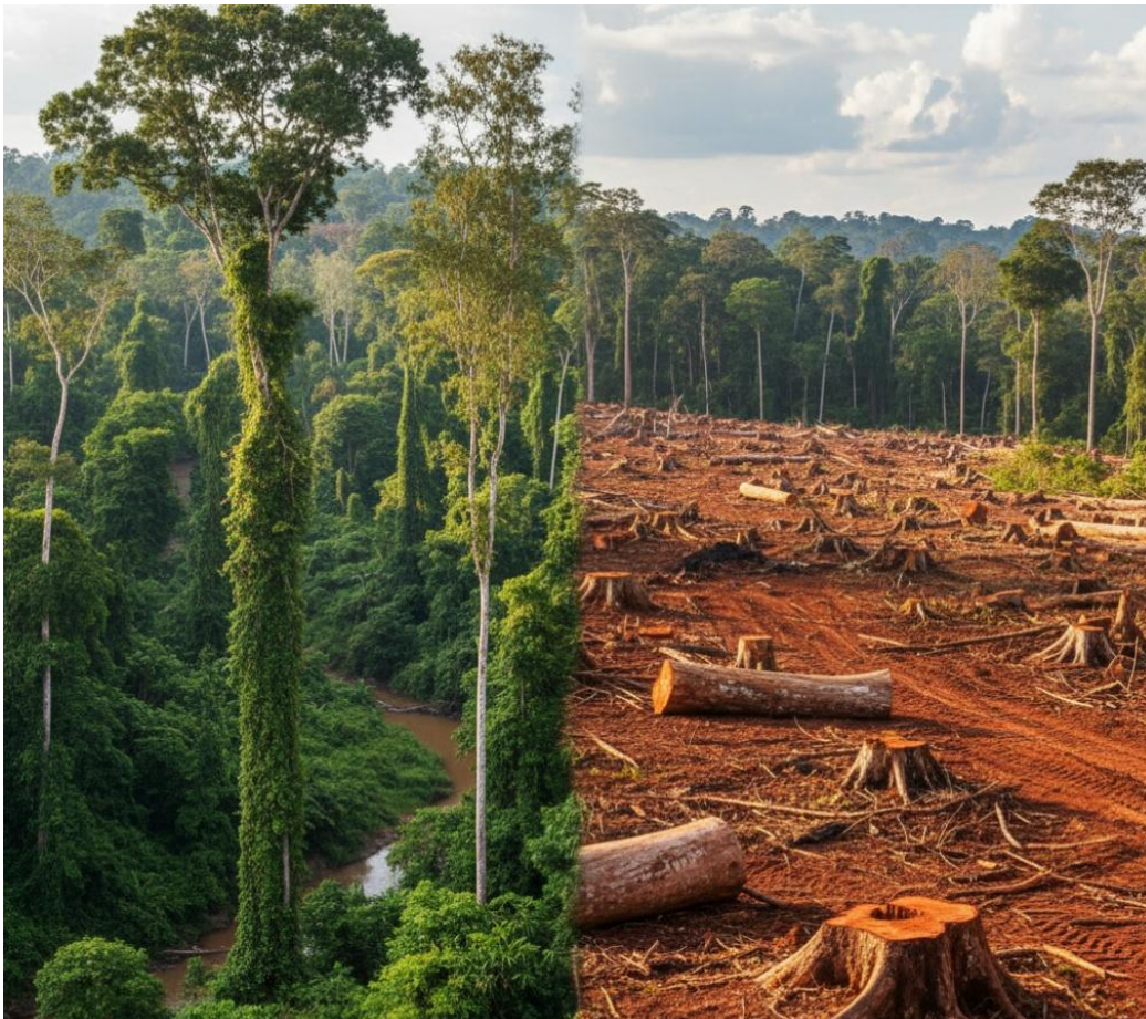
KI-generiert mit Flux (Prompt: Auf der linken Bild sieht man intakten tropischen Regenwald und auf der rechten eine abgeholzte Fläche mit abgesägten Baumstümpfen und roter Erde.)